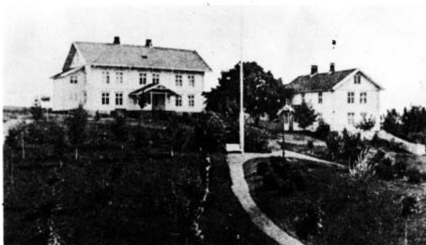
Til venstre hovedbygningen og til højre vilkårsbygningen på Præstesæter.