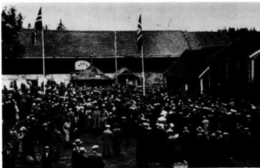
Fra den første museumsfesten på Stenberg (Toten Museum) i august 1931.

Forøvrig er benyttet primærkilder i Toten Museums regional-historiske arkiv